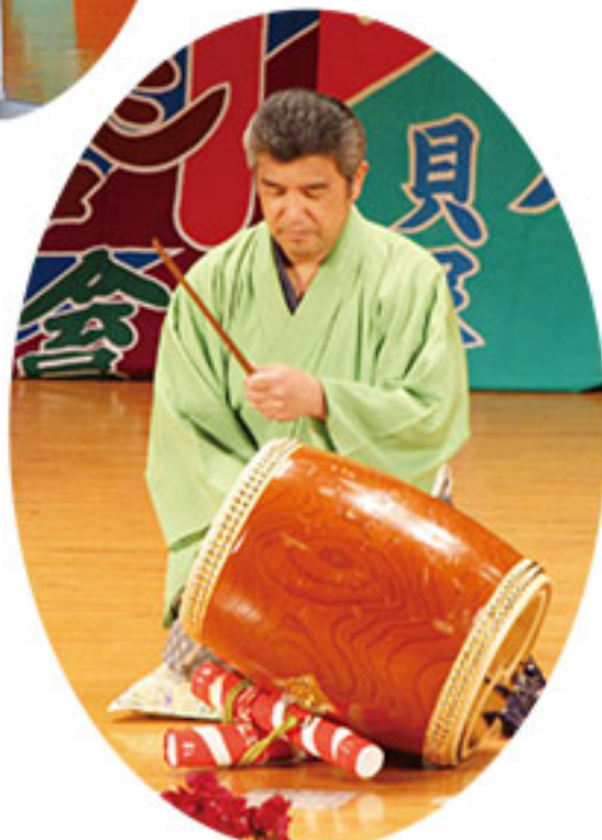
▲副立呼出し 拓郎さん