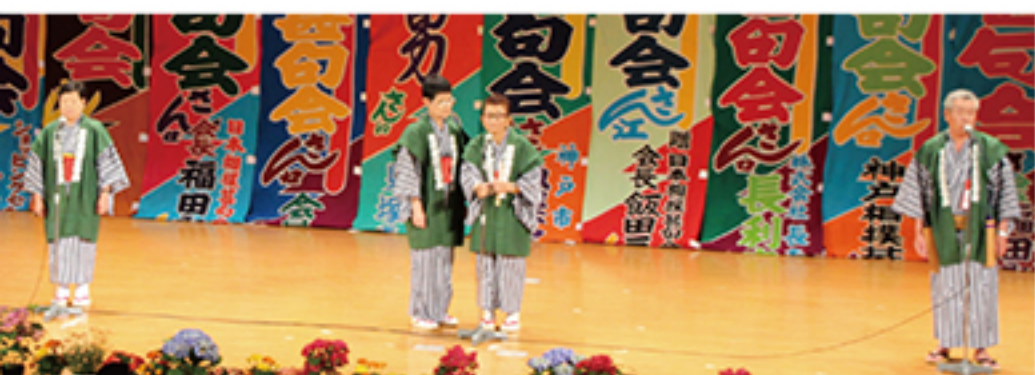
甚句会 ▲秦野相撲甚句会