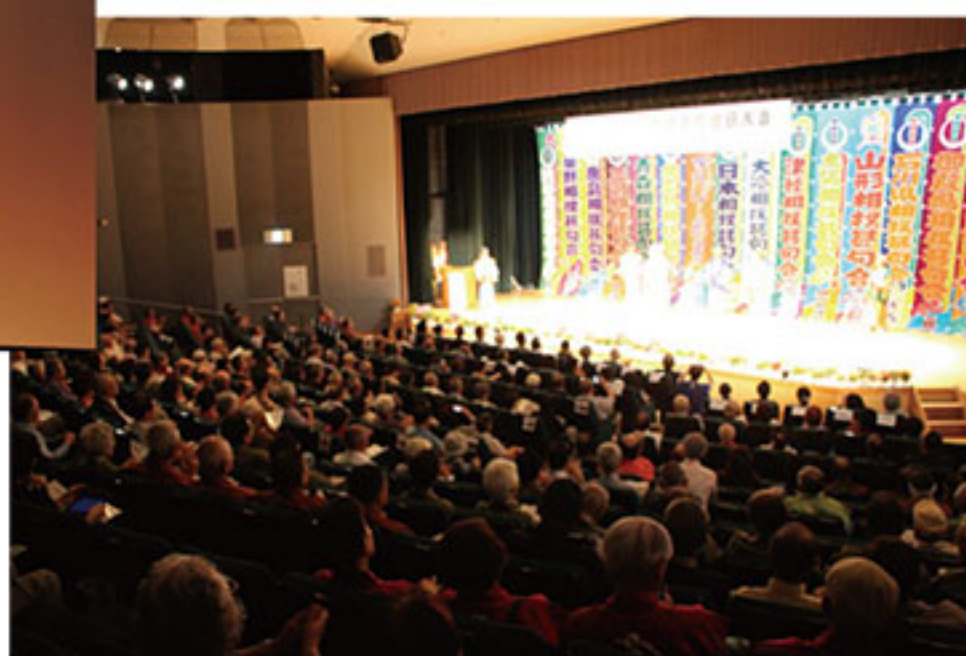
▲会場は人・人・人で、はちきれんばかり