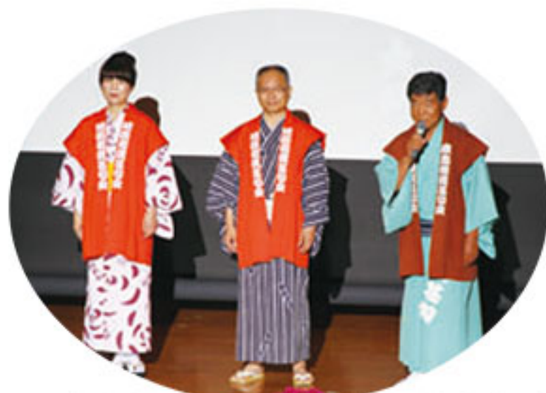
▲ことしも名司会者が楽しませます