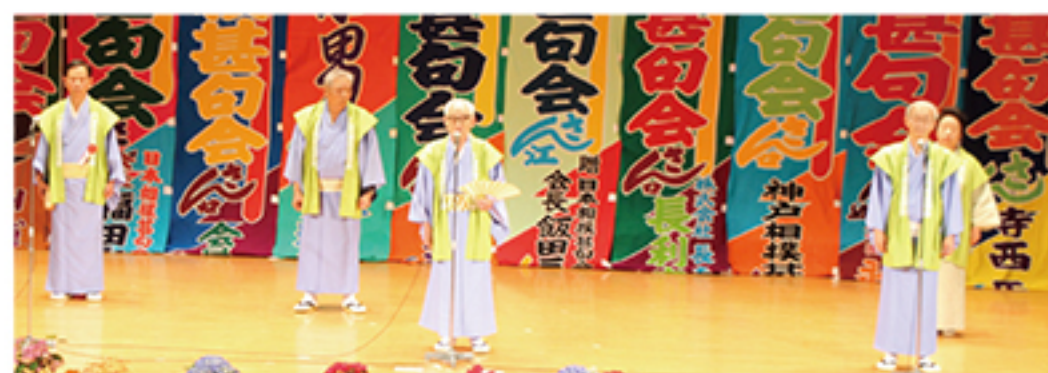
▲いしかわ相撲甚句会