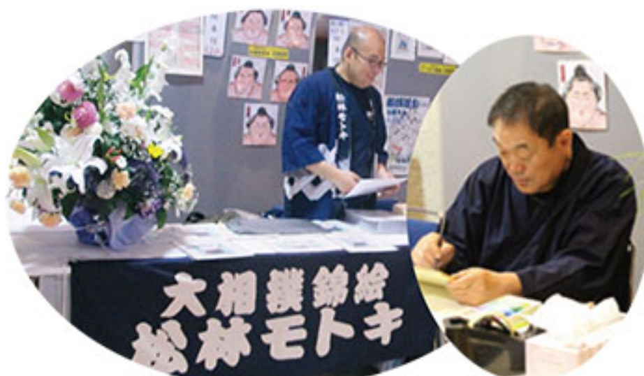
▲プログラム也大評判でした