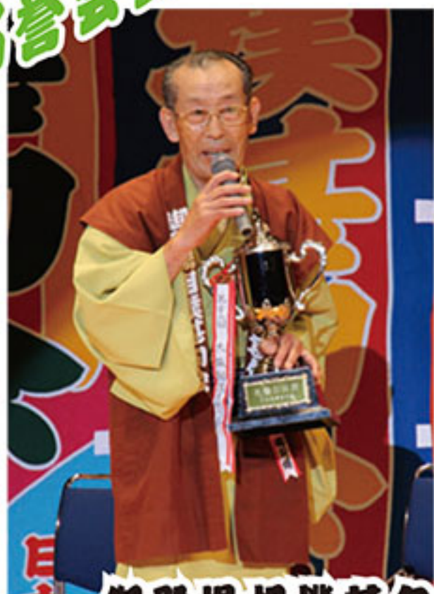
御殿場相撲甚句会