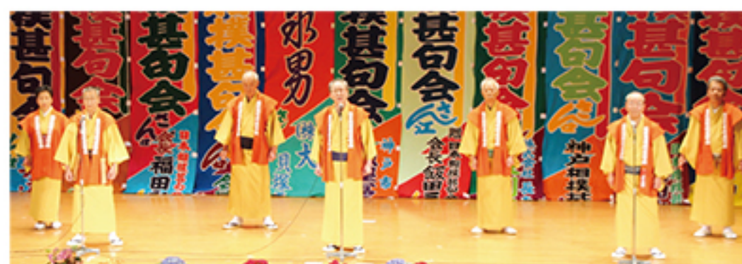
▲北広島相撲甚句会