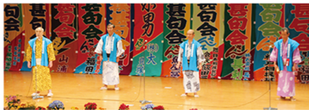
▲隅田川相撲甚句会