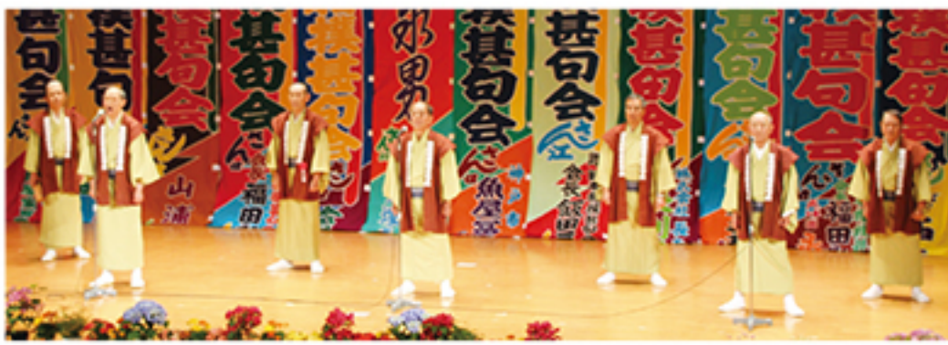
▲御殿場相撲甚句会