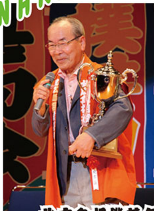
北広島相撲甚句会