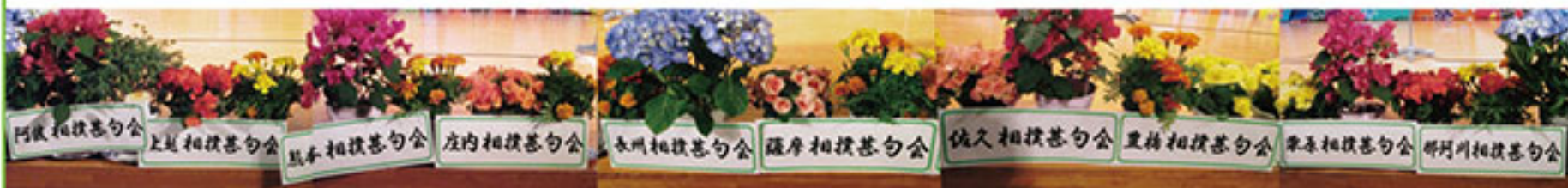
賛助団体の皆様も舞台を彩っていただきました